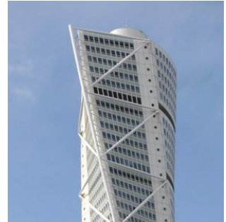
Turning Tower - Malmö (Suède) 2005