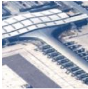
Barcelone Airport T1 (Espagne) 2008