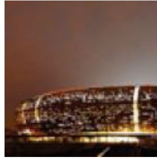
Soccer City Stadium Johannesburg (Afrique du sud) 2009