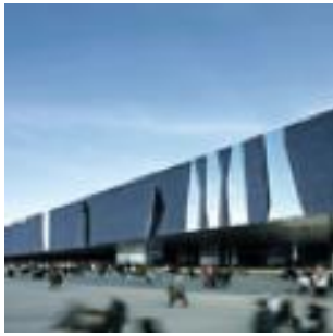
Forum des cultures, Barcelone, Espagne. Herzon & de Meuron