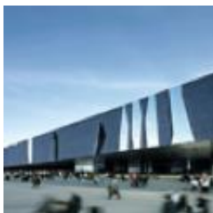
Forum des cultures, Barcelone, Espagne. Herzon & de Meuron