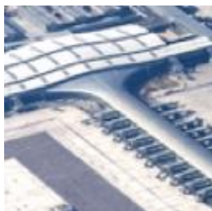
Barcelone Airport T1 (Espagne) 2008