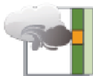
Etanchéité à l'air